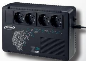
Zen Live 500 / 650 VA