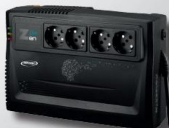
Zen Live 800 / 1000 VA